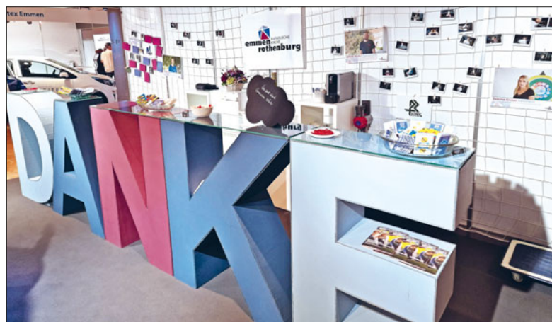
Die Katholische Kirche Emmen nutzt die Gelegenheit, um Danke zu sagen.