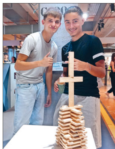
Emmer Oberstufenschüler präsentieren ihre «Kirche der Zukunft».