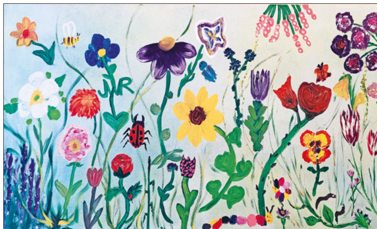
Am Ehrenamtlichenfest gemalt: das Bild im Kafi metenand.

Am Donnerstag, 19. Oktober, um 13.30 Uhr öffnet das neu gestaltete Kafi metenand im Pfarrhaus Bruder Klaus seine Türen.