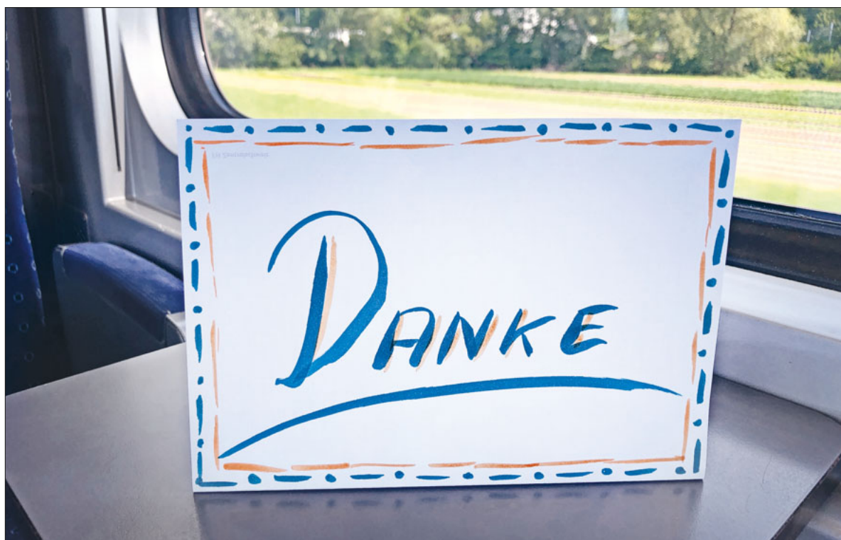
Danke! Ein kleines Wort mit grosser Wirkung.

Die Katholische Kirche Emmen-Rothenburg zeigte sich an der «Gwärb Ämme 23». Seite 6