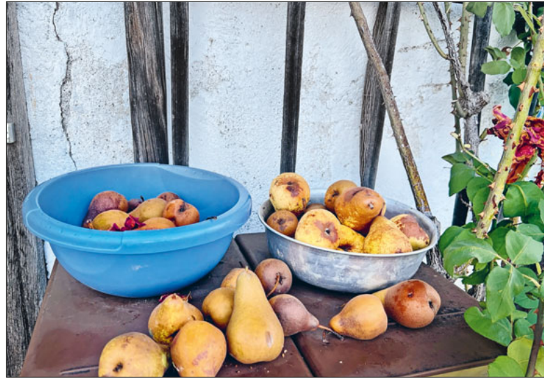
Das Glück einer reichen Ernte.

Bald wird wieder landauf und landab Erntedank gefeiert. Dabei bestellen nur noch wenige Menschen in der Schweiz eigene Felder oder Gärten.