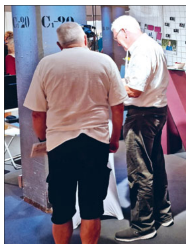
Der Stand bot vielfältigen Gesprächsstoff.