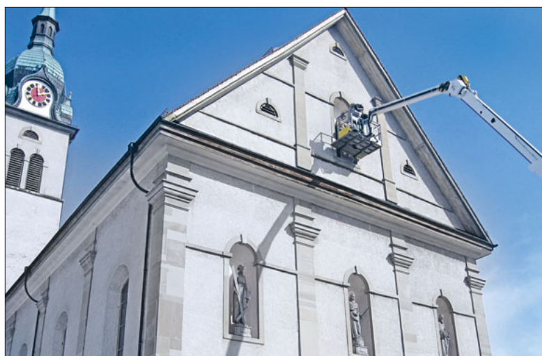
Wer darf hier schweben?

Was geht hier vor? Finden Sie die Lösung mit folgenden Hilfestellungen: Einer für alle, alle für einen/ Sanierung 2005/Patrozinium.