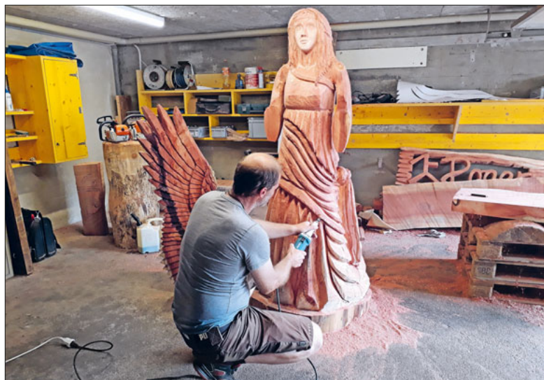
Ein Engel wird über die Heimgegangenen der Pfarrei wachen.