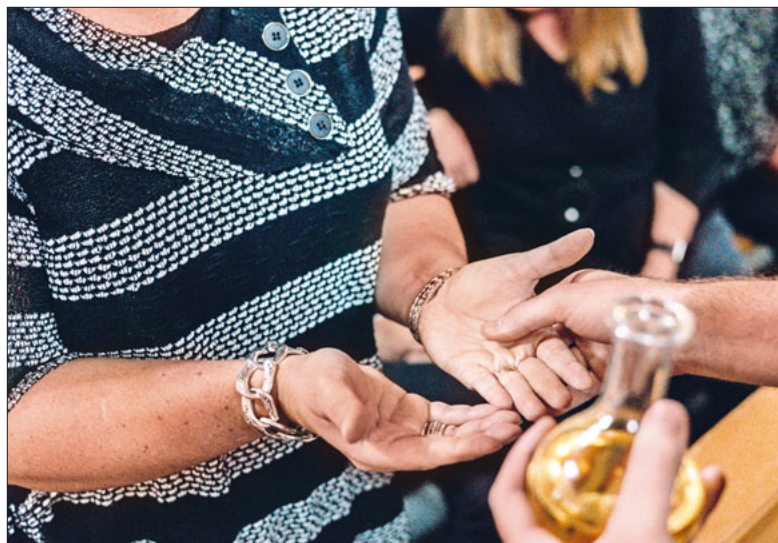
Sanfte Berührung mit dem heiligen Öl.

Was auch immer zur Krankheit führte und wie sie verläuft: Gott ist mit dir. Diese Zuversicht bringt das Sakrament der Krankensalbung in einem zärtlichen Gestus zum Ausdruck.