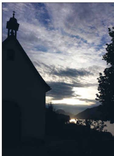
Dunkle Wolken ziehen über der Kirche auf.

Ich bin dankbar, dass die Wahrheit, wenn auch viel zu spät, endlich ans Tageslicht kommt. Wie gehen wir nun weiter als Kirche, als Pastoralraum? Auch wenn die meisten Fälle Jahrzehnte zurückliegen und die