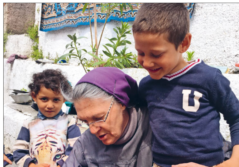
Besuch bei einer Romafamilie.

Offizielles Pfarreiblatt der Römisch-katholischen Kirchgemeinde Emmen Erscheint vierzehntäglich donnerstags Herausgeberin: Katholische Kirchgemeinde Emmen, Kirchfeldstrasse 2, 6032 Emmen Redaktion Pfarreiseiten: Pfarreisekretariate Redaktion Pastoralraumseiten: Marianne Grob Redaktion Notabene: Sandra Mollet Gesamtredaktion: Esther Häfliger esther.haefliger@kath.emmen-rothenburg.ch Druck und Versand: Multicolor Media Luzern, Maihofstrasse 76, 6006 Luzern, www.multicolorluzern.ch