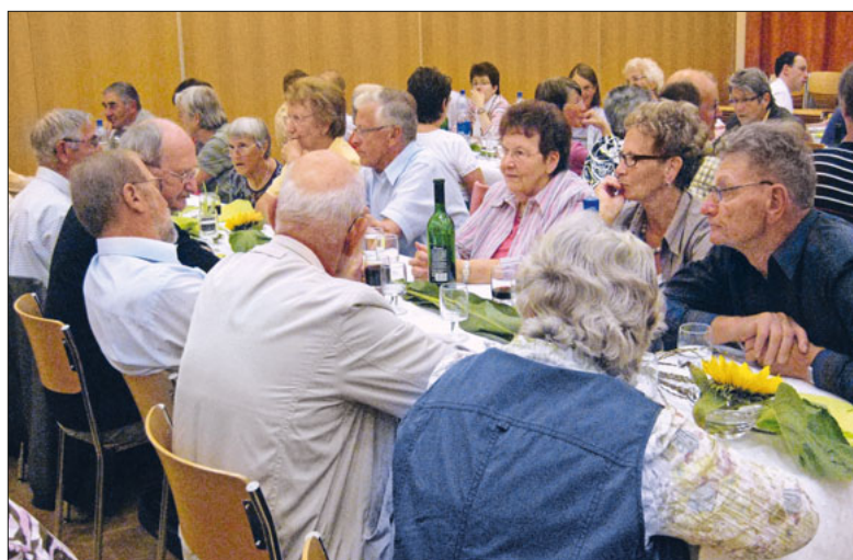
Gelegenheit zum Austausch, hier im Jahr 2010.

Wir freuen uns, Sie nach dem Gottesdienst am 29. Oktober um 10.45 Uhr an der Pfarreizusammenkunft im Pfarreizentrum Emmen begrüßen zu dürfen. Die Veranstaltung wird vom Pfarreirat St. Mauritius organisiert und vom Kirchenrat Emmen begleitet.