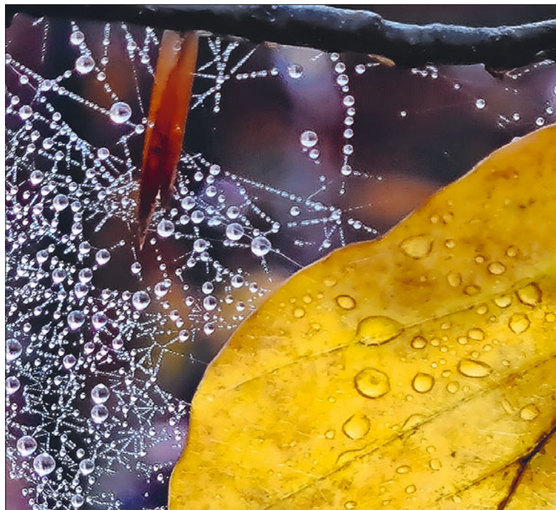
Lebensperlen und Vergänglichkeit.