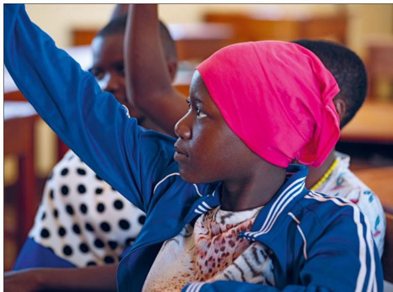
Bildung ist Zukunftsperspektive.

Dank Spenden kann zöndhölzli Menschen unterstützen, die am Rand der Gesellschaft stehen. Dies geschieht in Zusammenarbeit mit Projektverantwortlichen vor Ort.