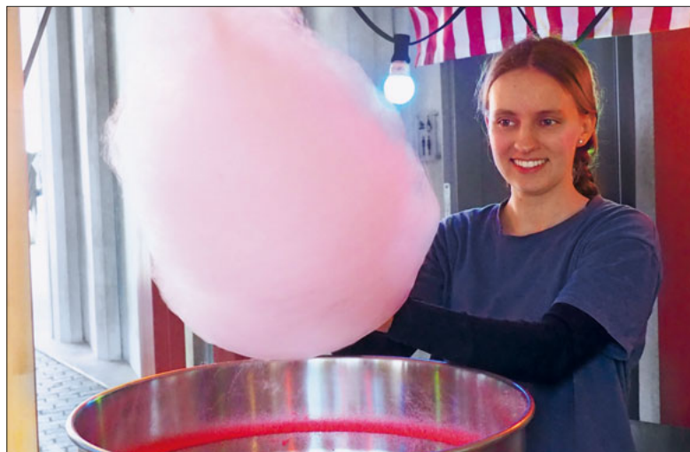
Das Pfarreifest verzaubert Jung und Alt.

Am Samstag, 21. Oktober findet das beliebte Pfarreifest im und am Pfarreizentrum Bruder Klaus statt. Das Motto «Herbstzauber» soll alle Besucherinnen und Besucher herbstlich verzaubern.