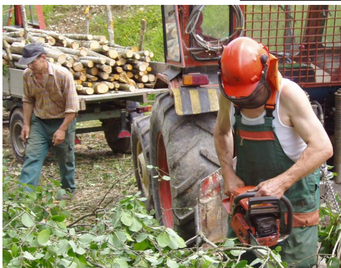
„Ofengerechte“ Holzstücke zuschneiden für die Spalten-Heizung.

Wer hätte Zeit und Lust, an einem solchen Einsatz mitzuwirken oder generell in der Gruppe Aktion „!“ mitzumachen? Interessierte sind herzlich willkommen. Nähere Informationen über das Pfarreisekretariat: Tel. 041 280 23 23.