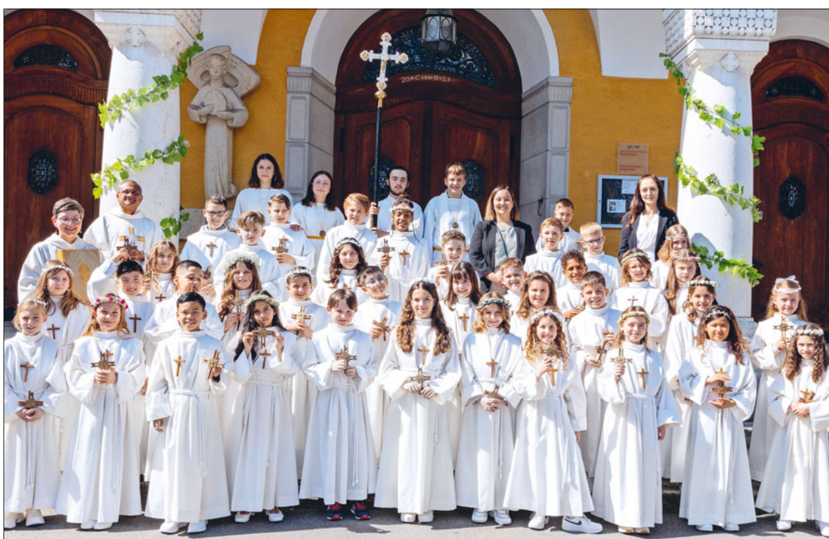
Die Erstkommunionkinder, Katechetinnen und Seelsorgenden der Pfarrei Gerliswil.