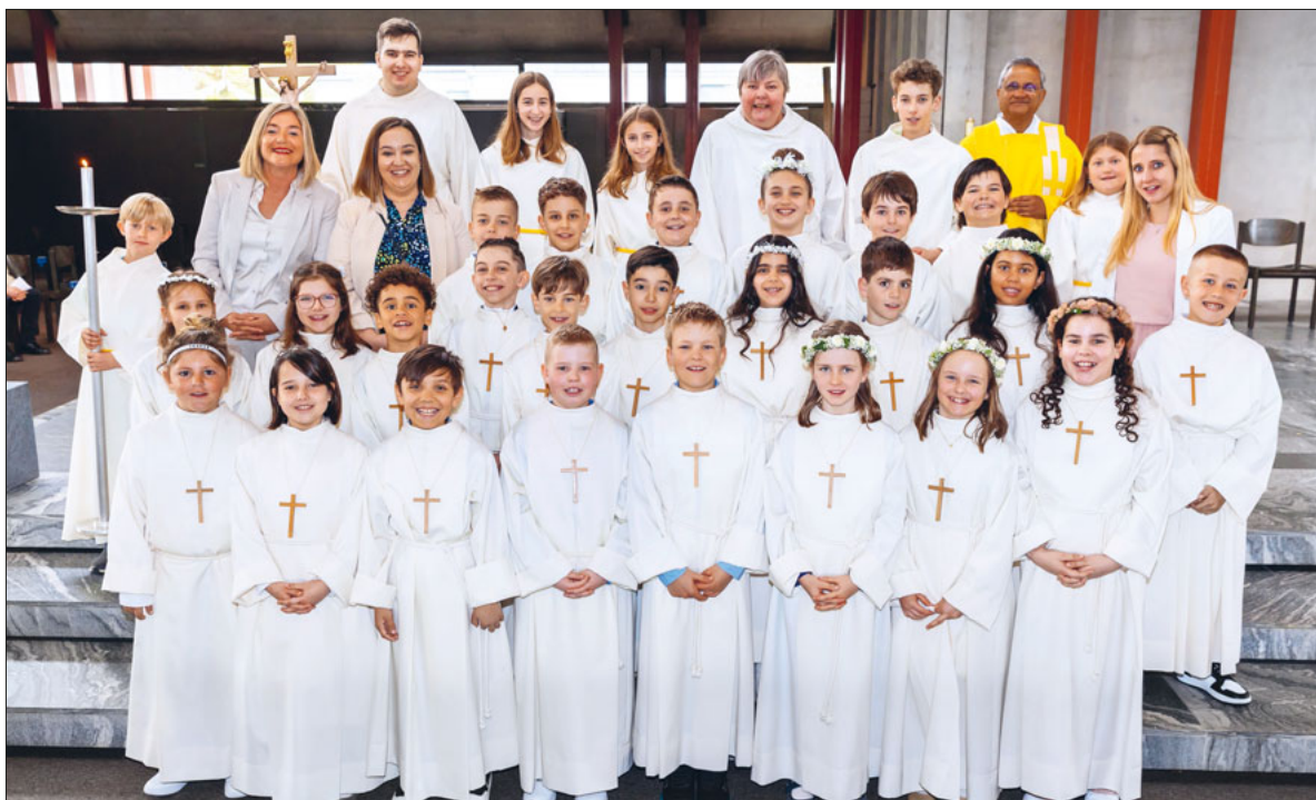
Die Erstkommunionkinder, Katechetinnen und Seelsorgenden der Pfarrei Bruder Klaus.