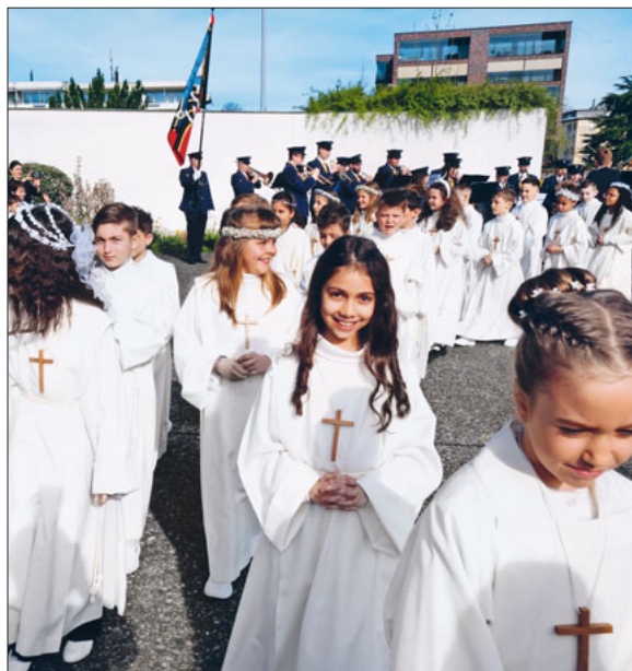
Einzug in die Pfarrkirche St. Maria.

An dieser Stelle sei allen Helferinnen und Helfern für ihr Mitwirken ganz herzlich gedankt. Ein ganz besonderes Dankeschön gilt auch unseren Religionslehrpersonen für die gelungene Organisation und Durchführung der Feiern. Zudem sind wir dankbar für ihre Bereitschaft, aufgrund unfall- und krankheitsbedingter Ausfälle pfarreiübergreifend und teilweise kurzfristig einzuspringen und auszuhelfen.