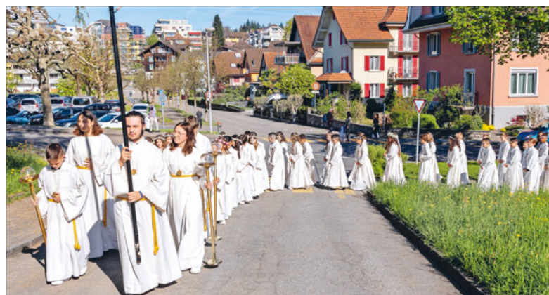
Einzug bei strahlendem Sonnenschein in Gerliswil.