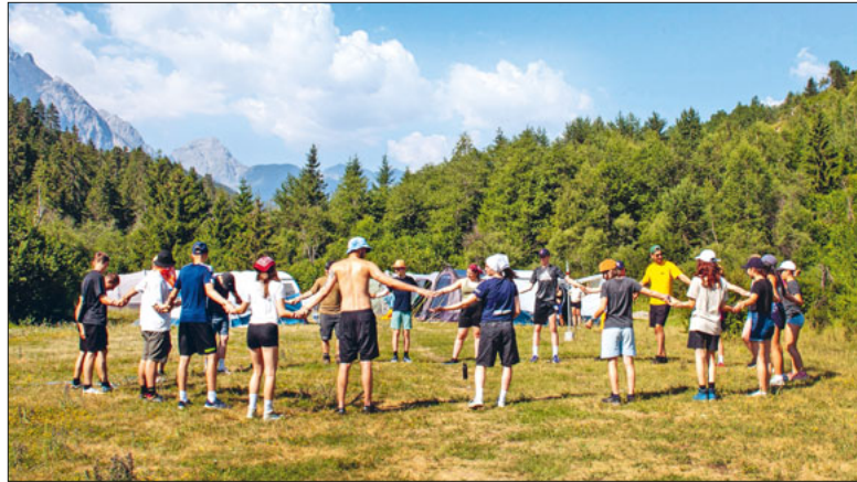
Die Jubla geht vom 8. bis 19. Juli ins Lager. Komm doch mit!

Bald ist es wieder soweit! Blauring und Jungwacht Emmen verreisen für zwei Wochen ins Sommerlager nach Schüpfheim im schönen Entlebuch. Herzlich eingeladen sind alle Kinder und Jugendlichen ab der ersten Klasse.