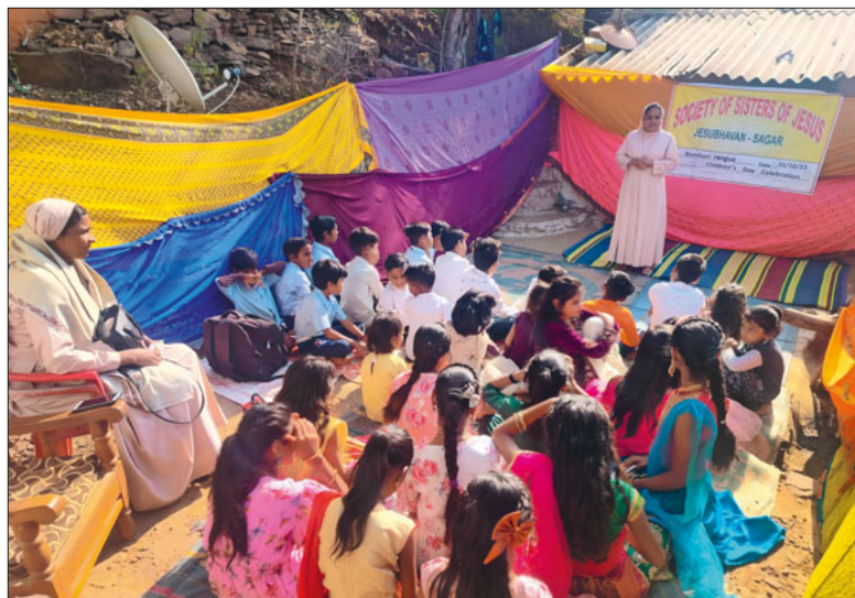
Dorfschule in Inthkeri.

Bildung ist der beste Weg aus der Armut und hin zu einem selbstbestimmten Leben. Das gilt auch in Madhya Pradesh, einem armutsbetroffenen Bundesstaat in Zentralindien.