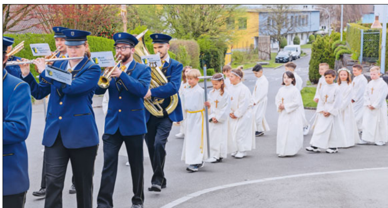
Feierlicher Einzug mit der Musikgesellschaft Emmen in Bruder Klaus.