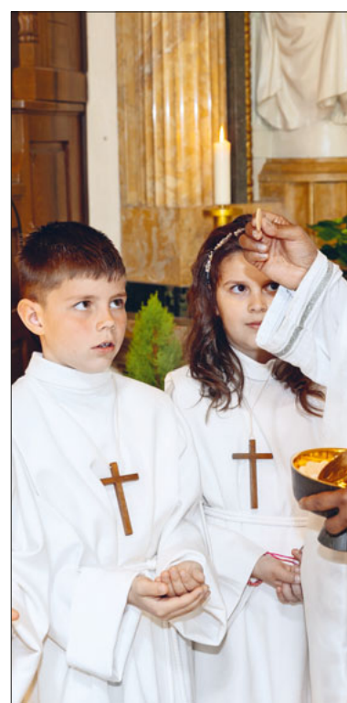
Die erste heilige Kommunion.