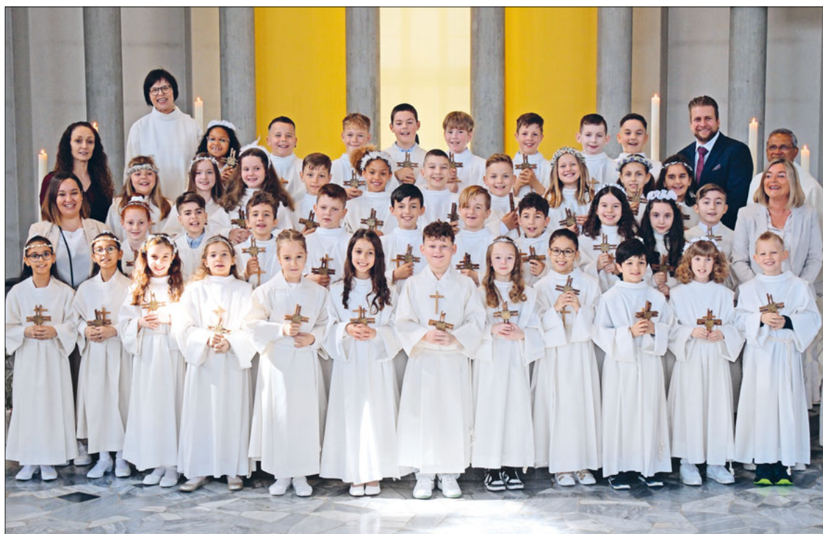
Die Erstkommunionkinder, Katechet:innen und Seelsorgenden von St. Mauritius und St. Maria.