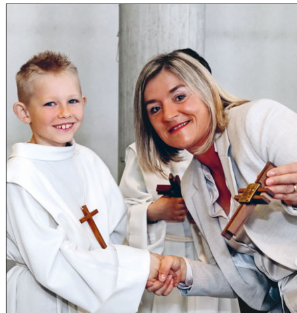
Das Kreuz als Andenken an die Erstkommunion.