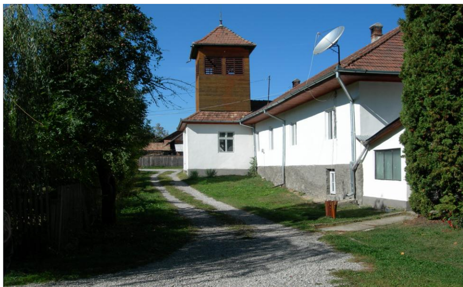
Kapelle mit Pfarrhaus – bereits mit neuer Fassade – wird zu einem Jugendzentrum