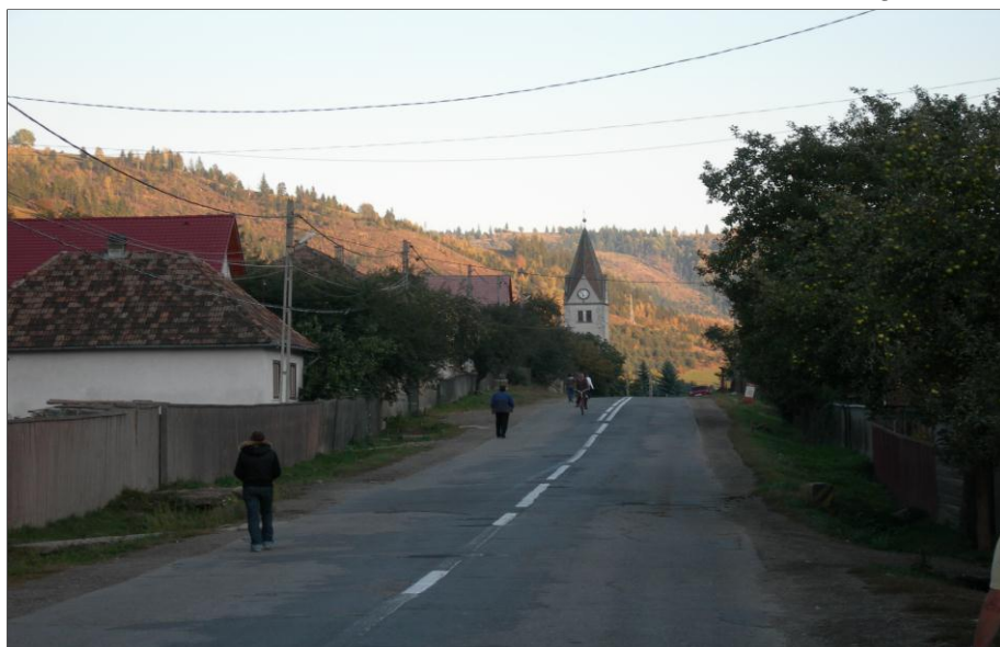
Strasse von Ghimes-Fäget - im Hintergrund die Pfarrkirche