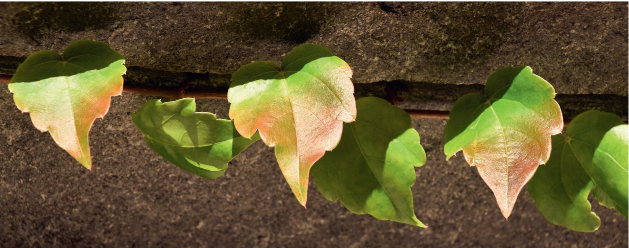
Efeublätter an einer Hausmauer im Centovalli

W ir sind alle Blätter an einem Baum, keins dem anderen ähnlich – das eine symmetrisch, das andere nicht, und doch gleich wichtig dem Ganzen.