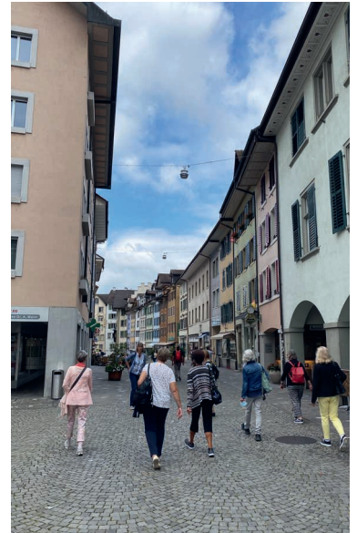
Erkundung des historischen Städtchens Bremgarten.