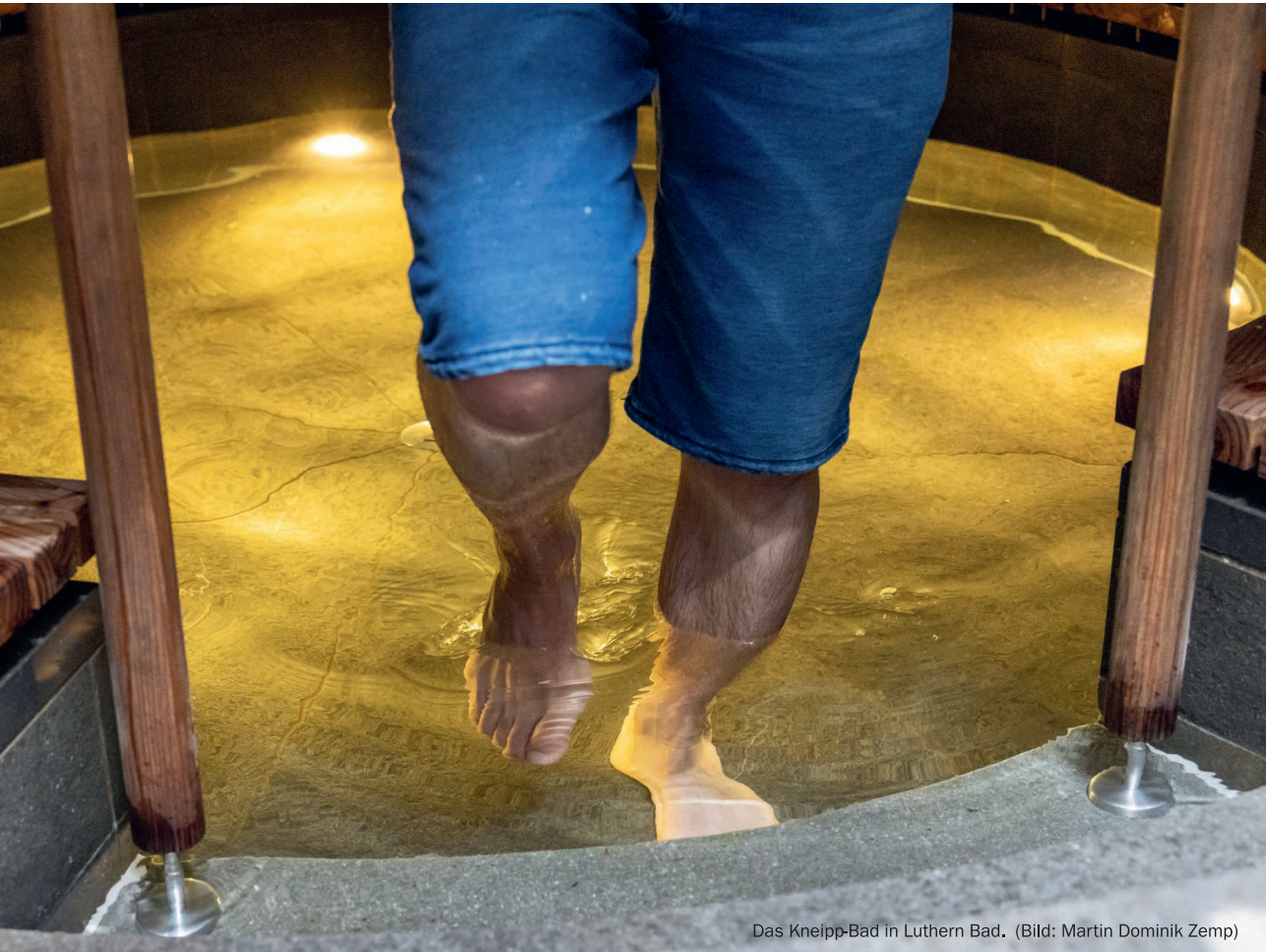
Das Kneipp-Bad in Luthern Bad.

Pastoralraum Emmen-Rothenburg Pfarrei St. Barbara Rothenburg