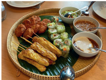
Genussvoller Abstecher nach Thailand.