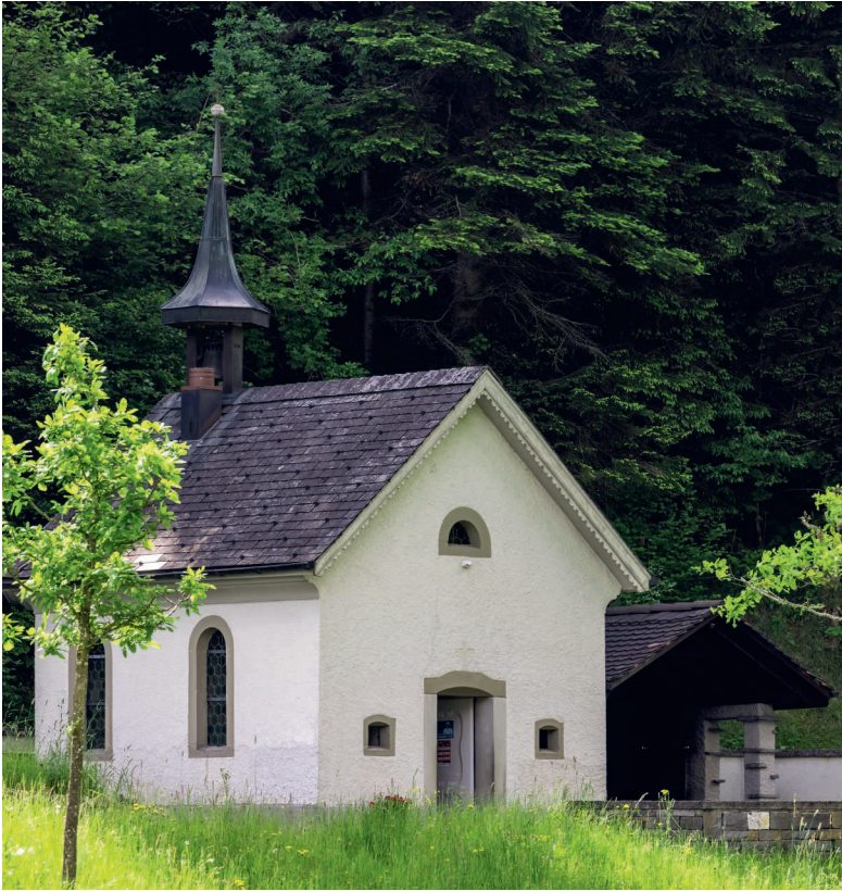
Beim Badbrünnli rechts von der Gnadenkapelle füllen Gläubige das Wasser flaschenweise ab.