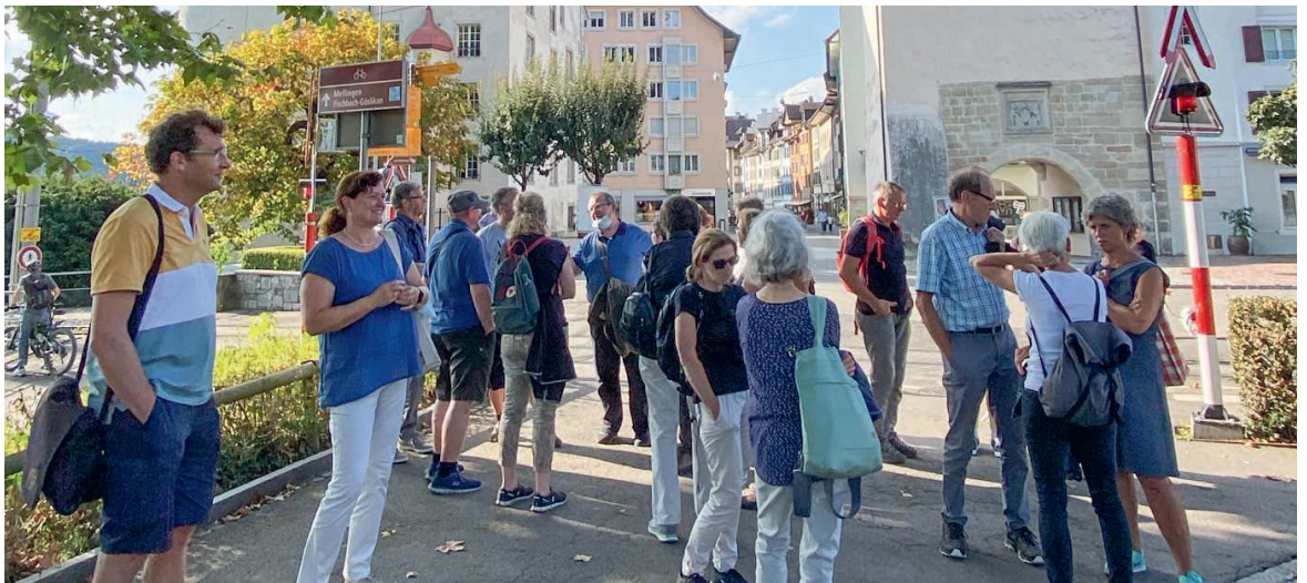
Die Cantus-Mitglieder genossen die Stadtführung durch das sonnige Bremgarten.