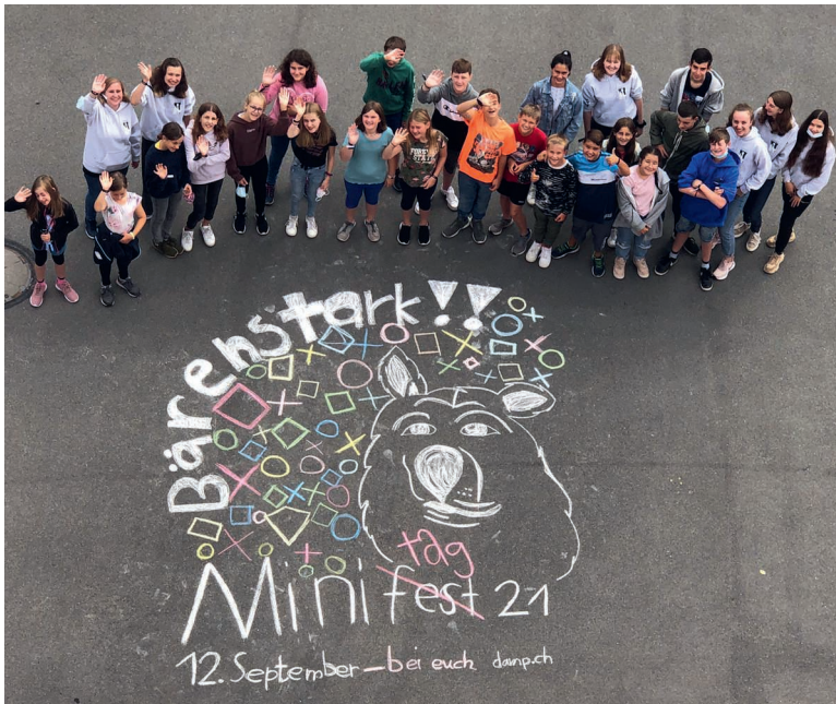
Aufgabe gelöst: Das Festmotto wurde mit Strassenkreide auf den Kirchplatz gemalt. Bärenstark umgesetzt von unserer Minischar.