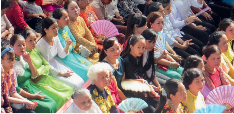
Gottesdienstbesuch in einer der vielen Pfarreien in Ho-Chi-Minh-Stadt.

Monat der Weltmission thematisiert Kirche in Vietnam