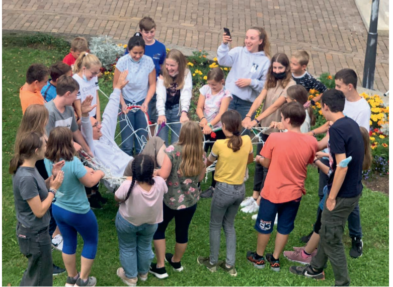
Aufgabe gelöst: Das selbstgeknüpfte Netz trägt selbst den Mini-Präses.

Das Programm für den Tag hatte das Organisationskomitee vom Minifest 21 erarbeitet – so waren die Scharen zwar nicht beisammen, hatten aber die gleichen Aufgaben zu lösen. Eine Challenge, wie die Aufgaben hiessen, bestand darin, das Festlogo möglichst gross mit Strassenkreide auf den Kirchplatz zu malen. Für eine andere wurden Mini-Kordeln und andere Seile zu einem grossen Netz verknö-