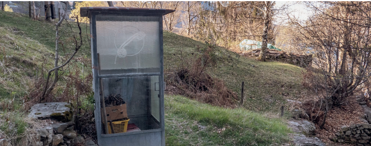
Ausgediente Telefonkabine in einer Siedlung oberhalb von Bellinzona.