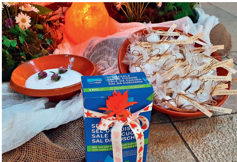
Am 4. Juni wird mitgebrachtes Salz gesegnet.

Die Seelsorgenden der Kath. Kirche Emmen-Rothenburg