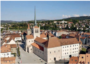
Die Abteikirche von Payerne ist die grösste romanische Kirche der Schweiz.

Das Museum der Abteikirche in Payerne wurde mit einem europäischen Preis ausgezeichnet. Die Jury der «European Museum of the Year Awards» zeichnete damit eine Institution aus, «die sich in einem der wichtigsten Meisterwerke der romanischen Architektur befindet». Das Museum bietet den Besucher:innen eine «sinnliche, lebendige und emotionale» Erfahrung. Die im 11. Jahrhundert erbaute ehemalige Klosterkirche im Kanton Waadt ist seit 2020 ein Museum.