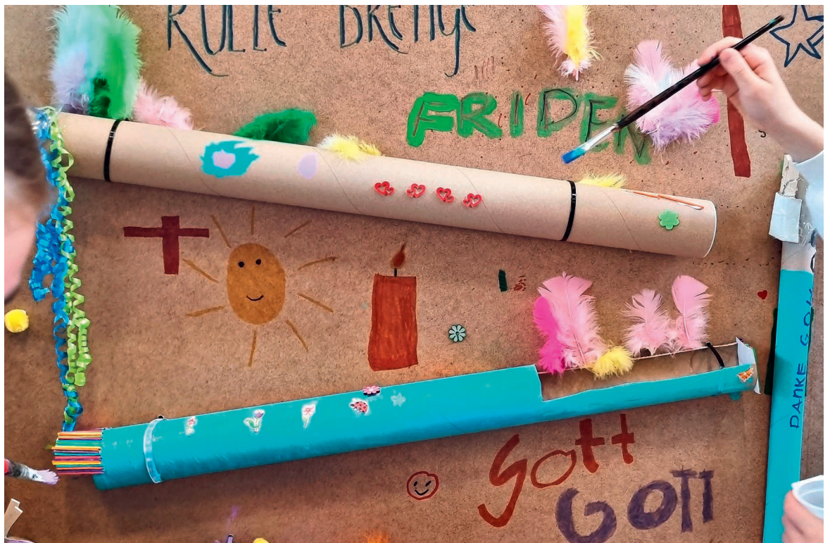
Das Leben gleicht manchmal einer Kugelbahn.