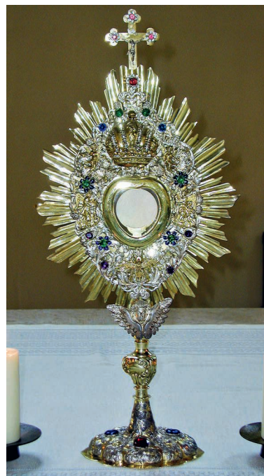
Das «Brot des Lebens», das in der Monstranz an der Fronleichnamsprozession mitgetragen wird.

Auf unserer Webseite und unter 041 280 13 28 (Anrufbeantworter) erfahren Sie am Morgen den definitiven Treffpunkt.