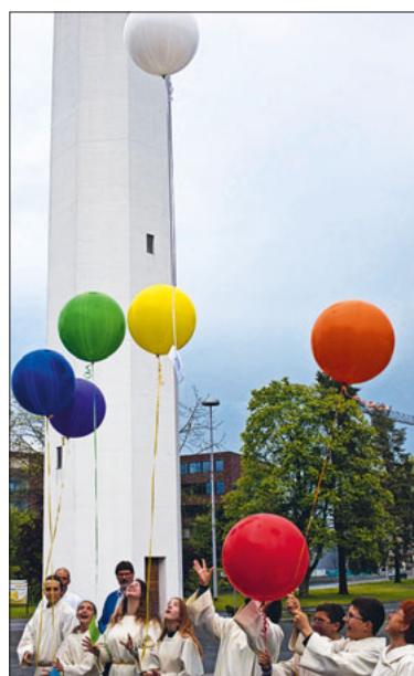
Wünsche an den Himmel.