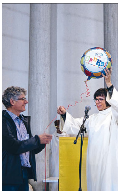
Danke fürs Engagement!