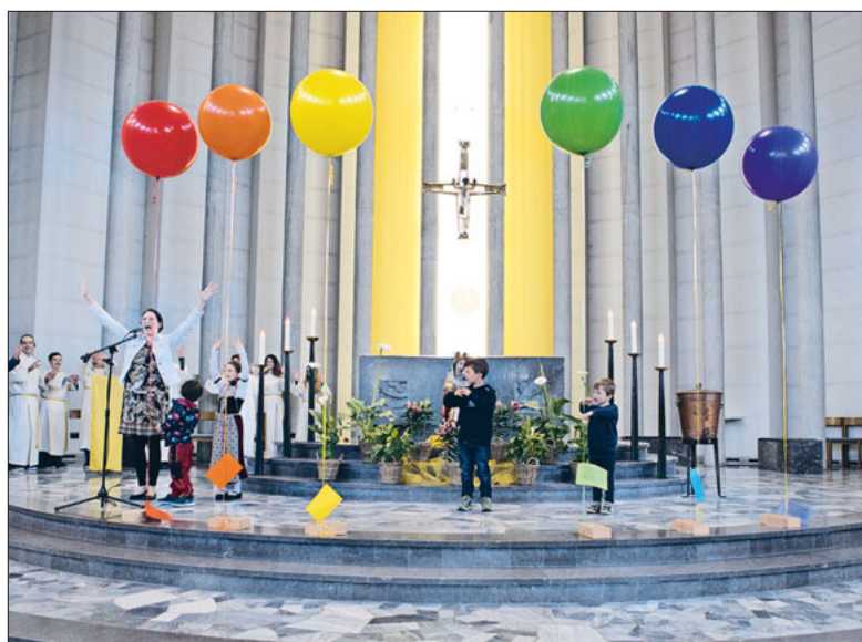
Die Farben finden zusammen beim «Rägebögler».