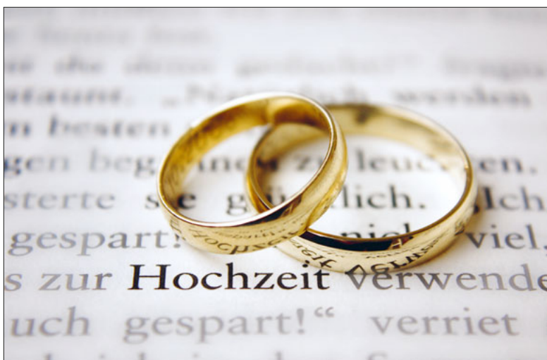
Gemeinsam durchs Leben.