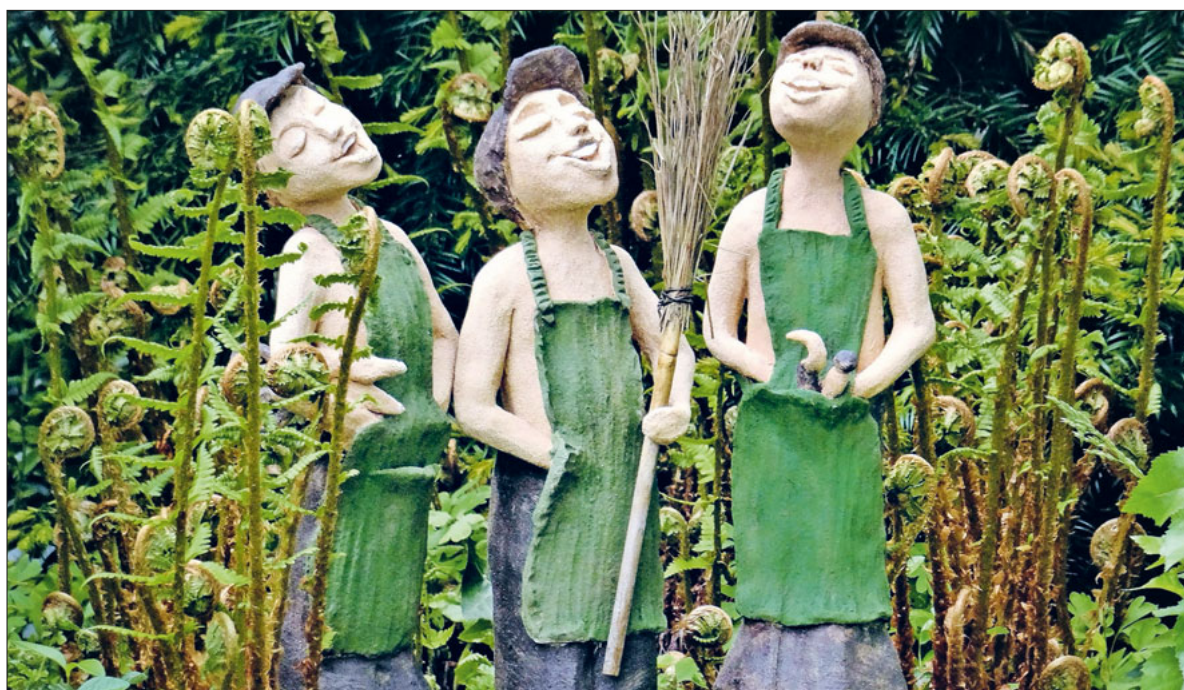
Singt Gott zu, musiziert seinem Namen! (Psalm 68,5)

An der Frühlingsession wurde ein positiver Rechnungsabschluss präsentiert. Seiten 5 bis 8