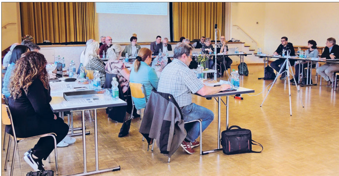
Frühlingsession von Kirchenrat und Kirchgemeindepament.

Postulat 3 der Fraktion Mauritius, vertreten durch Adrian De Souza. Forderung Postulat: «Anpassung Erfassung der Protokolle des KGP Emmen» . Wir fordern den Kirchenrat auf, dies zu prüfen und dem Kirchgemeindepament überarbeitete Artikel 42 ff. der