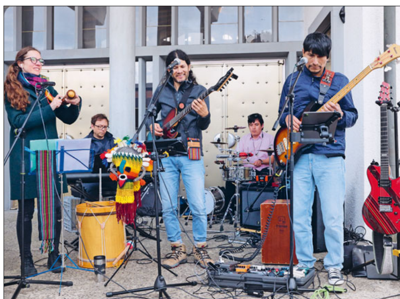
Pluma Salvaje: Heitere Musik unter dem Kirchendach.