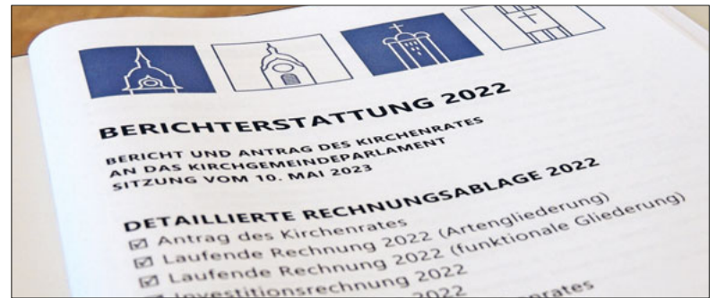
Der Kirchenrat informierte das Parlament vorgängig.

In der schriftlichen Berichterstattung hatte der Kirchenrat die Parlamentarier:innen schon im Voraus detailliert über seine Tätigkeiten im vergangenen Jahr informiert. Im Ressort Kommunikation lagen die Schwerpunkte bei den Gesamterneuerungswahlen des Kirchgemeindeparlaments und der Ressortverteilung des Kirchenrats für die Legislatur 2022 bis 2026. Es konnten stille Wahlen durchgeführt werden. Weitere Themen waren die Zusammenarbeit im Pastoralraum mit der Kirchgemeinde Rothenburg, personelle und infrastrukturelle Veränderungen und die Abstimmung über die Kirch-