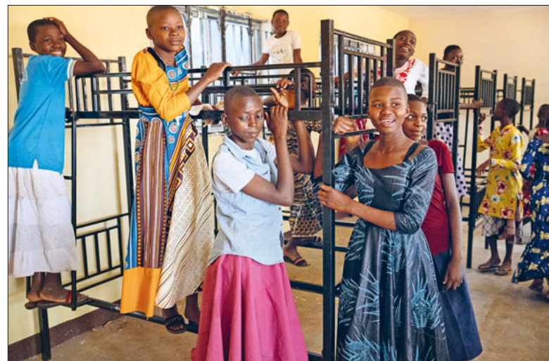
Schlafsaal der Mädchenschule in Lukuledi.

Offizielles Pfarreiblatt der Römisch-katholischen Kirchgemeinde Emmen Erscheint vierzehntägig donnerstags Herausgeberin: Katholische Kirchgemeinde Emmen, Kirchfeldstrasse 2, 6032 Emmen Redaktion Pfarreiseiten: Pfarreisekretariate Redaktion Pastoralraumseiten: Marianne Grob Redaktion Notabene: Sandra Mollet Gesamtredaktion: Esther Häfliger esther.haefliiger@kath.emmen-rothenburg.ch Druck und Versand: Multicolor Media Luzern, Maihofstrasse 76, 6006 Luzern, www.multicolorluzern.ch