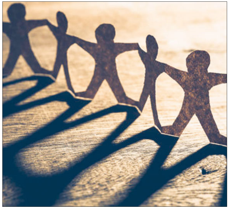
Freundschaft leben – Vertrauen schenken.

Trotz all der schönen Erinnerungen: Es ist Optimismus angebracht – Mut und vor allem ein offenes Herz für Neues! Der Übertritt in die Oberstufe bringt viel Neues mit sich. Ein neuer