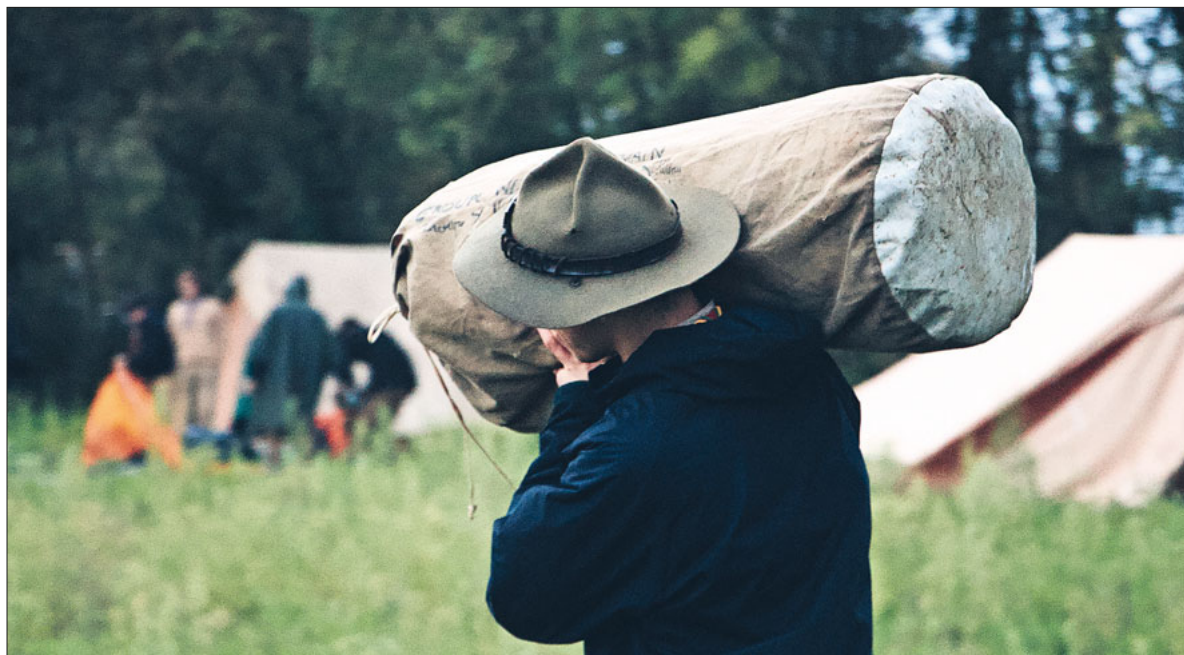
Jugendliche übernehmen als freiwillig Engagierte eine Vorbildfunktion.

Das neue Pfarrzentrum Gerliswil lädt zur Besichtigung der Baustelle ein. Seite 6