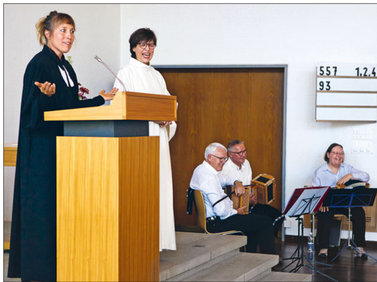
Humor – ein Zeichen der Lebenskunst.

Am Sonntag, 9. Juli, um 11.00 Uhr, unmittelbar vor den Sommerferien, treffen sie im Pfarreizentrum in St. Maria ein: die Frauen und Männer aus der Reformierten Kirche Meierhöfli und aus der Pfarrei St. Maria.